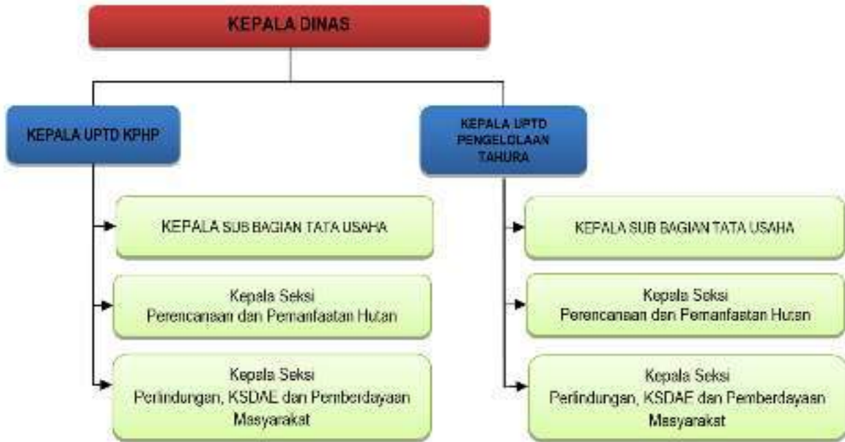
Bagan 2. STRUKTUR ORGANISASI UPTD