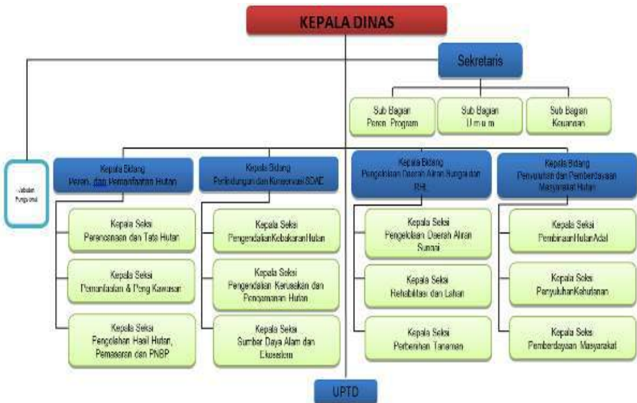
Bagan 1. STRUKTUR ORGANISASI DINAS

Berdasarkan garis hirarki dan tingkatan personil dapat digambarkan pada bagan struktur organisasi di bawah ini :