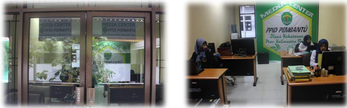
Foto Ruang Layanan Informasi Publik

Guna memperlancar pelayanan informasi publik PPID Dinas Kehutanan Prov. Kaltim menyediakan ruangan yang berisi 4 meja, 4 kursi staf dan 4 kursi tamu, 4 PC Desktop All In One dan 3 Laptop. Ruangan ini dilengkapi 1 AC, akses internet dan 2 rak lemari besar untuk menyimpan buku-buku tentang yang berhubungan dengan bidang kehutanan.