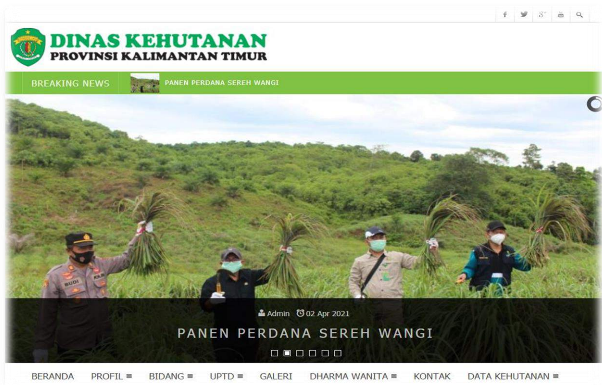
Gambar 1. Laman website resmi Dinas Kehutanan Provinsi Kalimantan Timur

Data-data yang terkumpul juga dapat di akses melalui website resmi Dinas Kehutanan Provinsi Kalimantan Timur yaitu http://dishut.kaltimprov.go.id pada bagian menu Data Kehutanan seperti pada gambar dibawah ini :