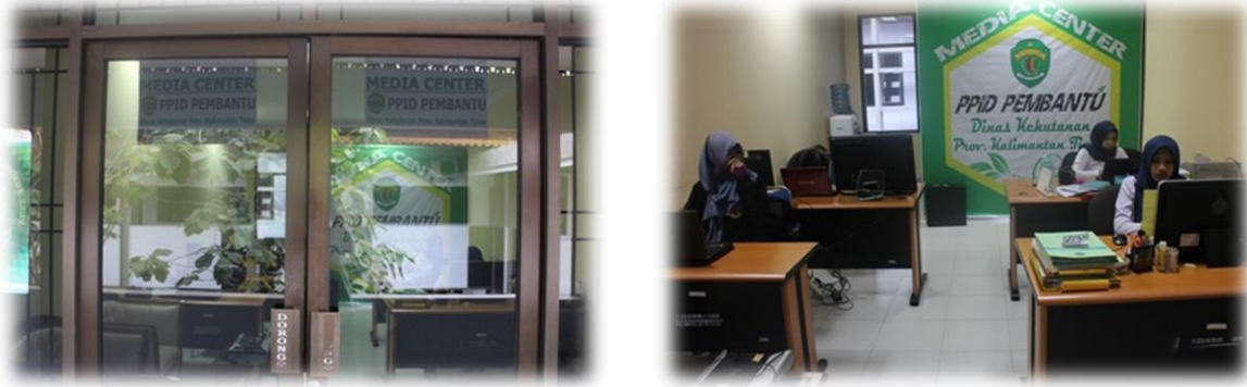
Foto Ruang Layanan Informasi Publik

Guna memperlancar pelayanan informasi publik PPID Dinas Kehutanan Prov. Kaltim menyediakan ruangan yang berisi 3 meja, 8 kursi, 4 PC Desktop All In One dan 2 Laptop. Ruangan ini dilengkapi 1 AC, akses internet dan 2 rak lemari besar untuk menyimpan buku-buku tentang yang berhubungan dengan bidang kehutanan.