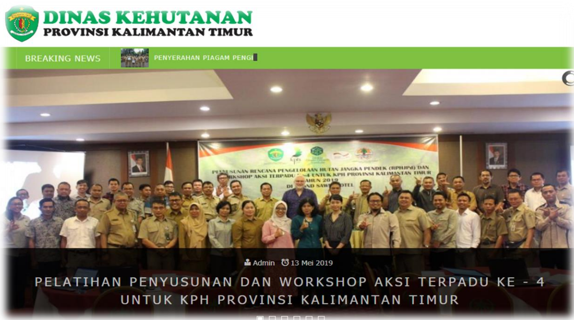
Gambar 1. Laman website resmi Dinas Kehutanan Provinsi Kalimantan Timur

Data-data yang terkumpul juga dapat di akses melalui website resmi Dinas Kehutanan Provinsi Kalimantan Timur yaitu http://dishut.kaltimprov.go.id pada bagian menu PPID seperti pada gambar dibawah ini :